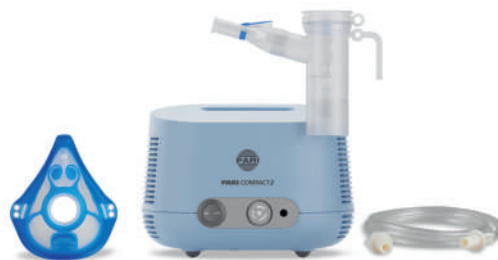
PARI COMPACT2 kompletní balení