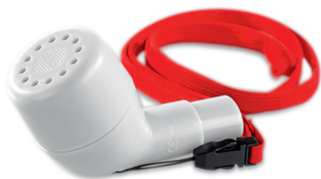
PARI O-PEP s pútkom