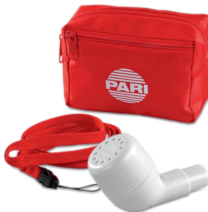
Kompletné balenie PARI O-PEP