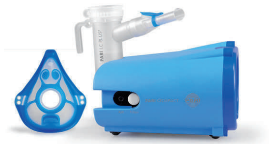
PARI Compact s maskou