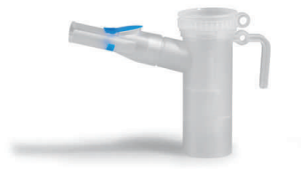
Nebulizér PARI LC PLUS

Vhodný k prevádzaniu inhalačnej terapie v pohodlí domova pre pacientov s ochorením dolných ciest dýchacích (astma, CHOPCH, bronchitída). Možno ho používať pre deti už od 4 rokov.