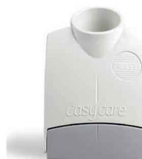
easycare - čistiaca pomôcka