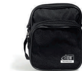
prepravná taška pre eFlow rapid