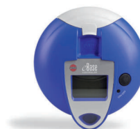
Riadiaca jednotka eBase

Vhodný pre veľmi účinnú a rýchlu inhalačnú terapiu pacientov nielen na cesty. Ideálny pre pacientov s cystickou fibrózou.