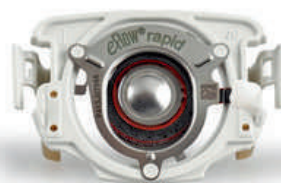
Vyvíjač aerosólu eFlow rapid

Balenie obsahuje dva kompletné nebulizéry 2.0 (vrátane vyvíjača aerosólu 2.0), jednoduchú čistiacu pomôcku, riadiacu jednotku s batériami, pripojovaciu hadičku, medzinárodný sieťový napájač so štyrmi výmennými adaptérmi, prepravnú tašku a vrecko na nebulizér.