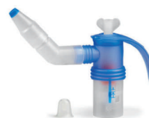
Nebulizér PARI LC SPRINT SINUS

Nebulizér PARI LC SPRINT SINUS je zložený z malého množstva dielov, takže môže byť rýchlo a jednoducho zostavený alebo rozložený. Tiež to uľahčuje jeho čistenie. Vďaka jeho užívateľskej prívetivosti a vynikajúcemu výkonu je ideálnym prostriedkom pre príjemnú a efektívnu inhaláciu.