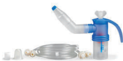
ročné balenie PARI LC SPRINT SINUS