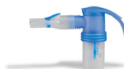
Nebulizér PARI LC SPRINT

Prístroj je možné zamenou nebulizéru PARI LC SPRINT SINUS za PARI LC SPRINT použiť tiež k liečbe dolných ciest dýchacích. Nebulizér PARI LC SPRINT je možné vybaviť rozdielne farebnými nastavkami trysiek, podľa tvorby rôznych veľkostí kvapôčok, ktoré ponúkajú riešenie prispôsobené individuálnym potrebám užívateľov podľa indikácie a vekovej skupiny. PARI LC SPRINT nie je súčasťou balenia.