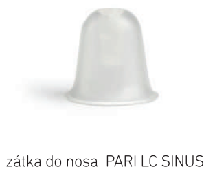
zátka do nosa PARI LC SINUS