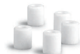
filter PARI BOY