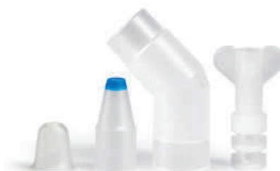
aplikačný set PARI LC SPRINT SINUS