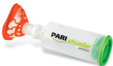
PARlchamber s maskou (0 - 2 roky)