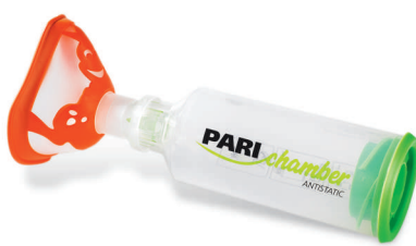
PARlchamber s maskou (> 2 roky)