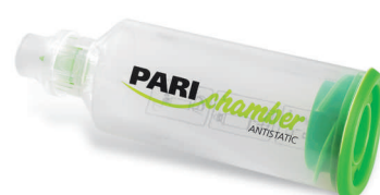
PARlchamber s náustkom (> 4 roky)